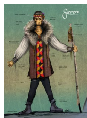
Boceto del vestuario de los protagonistas